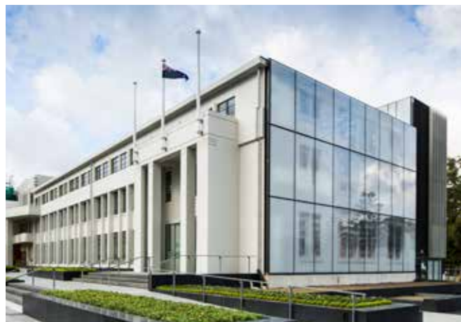
哈特市议会行政大楼