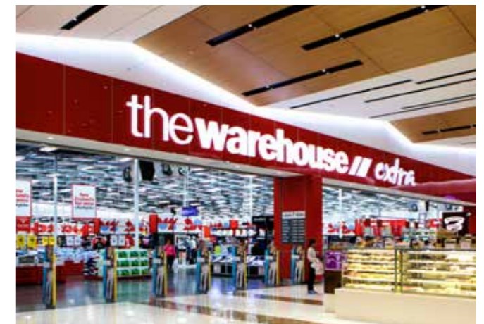
Sylvia Park区The Warehouse商场